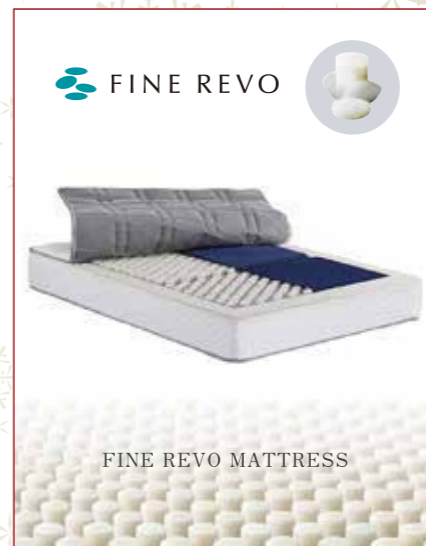
FINE REVO MATTRESS