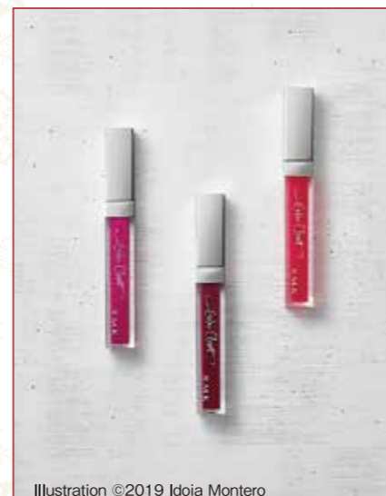
Illustration ©2019 Idola Montero