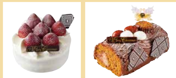
紀ノ国屋クリスマスショートケーキ 4号(直径約12cm) 3,000円(税抜) 紀ノ国屋プッシュドノエル 長さ約15cm/3,000円(税抜)

2F ジェルボー ※ご予約承り期間・お渡し期間等、詳しくは店頭までお問い合わせ下さい。