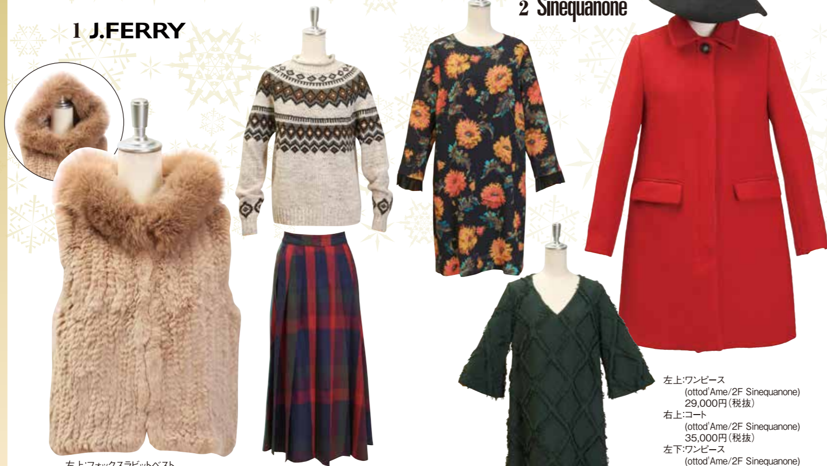
左上:フォックスラビットベスト 53,000円(税抜) 右上:ノルディックニットプルオーバー 12,800円(税抜) 右下:2WAYボタンチェックスカート 18,000円(税抜)