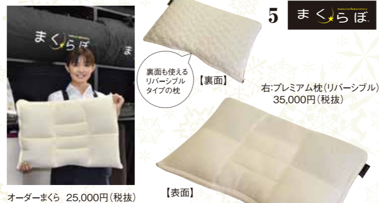
右:プレミアム枕(リバーシブル) 35,000円(税抜)