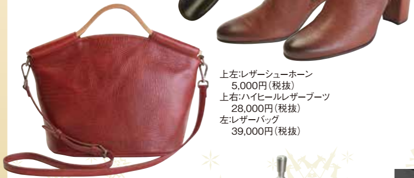
左上:レザーシューズホーン 5,000円(税抜) 上右:ハイヒールレザーブーツ 28,000円(税抜) 左:レザーバッグ 39,000円(税抜)