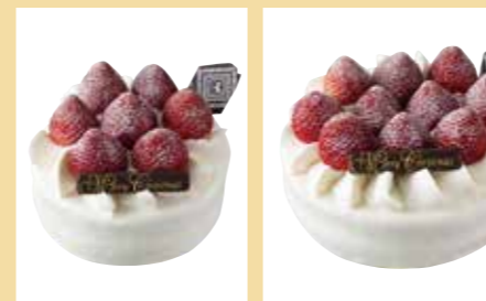
紀ノ国屋クリスマスショートケーキ 4号(直径約12cm)/3,000円(税抜) 5号(直径約15cm)/4,000円(税抜)