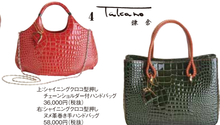
上:シャイニングクロコ押しチェーンショルダー付ハンドバッグ 36,000円(税抜) 右:シャイニングクロコ押しヌメ革巻き手ハンドバッグ 58,000円(税抜)